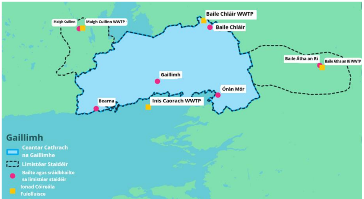
Figure 1-1: Limistéar Staidéir Straitéis Fuíolluisce na Gaillimhe